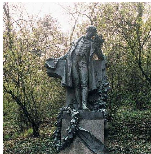
socha K.H. Máchy od J.V.Myslbeka (1912) v Praze na Petříně